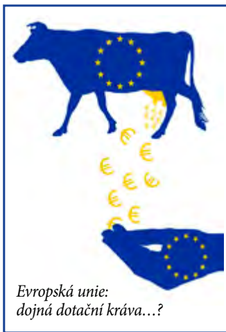
Evropská unie: dojná dotační kráva...?

„Komise se v roce 2019 sešla celkem sedmkrát a již v průběhu října na zasedání Senátu jsem předložil předběžnou zprávu, která konstatuje, že komise došla k předběžnému závěru o střetu zájmu pana předsedy vlády Andreje Babiše. Tento závěr vychází ze skutečnosti, že přestože pan předseda převedl své podniky (zjednodušeně Agrofert) do dvou svěrenských fondů, nenaplnil tím ale podmínky českého zákona a nařízení Evropské komise o střetu zájmu...“