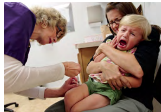
Očkování: někdy šok pro dítě i trauma pro rodiče.

Zastavíme se ještě u rodičů, jejichž děti žádnou anamnézu bránící očkování nemají, přesto se rodiče dobrovolně rozhodli dítě neočkovat. Tito rodiče se rozhodnou k podobnému kroku nejčastěji ve chvíli, kdy si přečtou informace v příbalových letáčích vakcín. Také často argumentují vysokým zdravotním rizikem po aplikaci očkování i tím, že sami lékaři nemají detailně nastudované informace