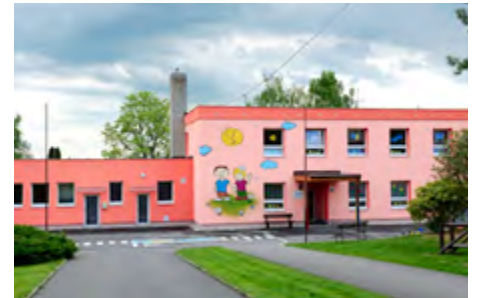
Ve Lhotce se staví, opravuje a vůbec dobře bydlí

V březnu jsem se starostou městského obvodu Mariánské Hory a Hulváky jednal i o aktuální potřebě zavedení bezdoplatkové zóny. – Od 7. května se toto opatření zavádí na celém území obvodu s výjimkou domova pro seniory Iris, domů s pečovatelskou službou a několika sociálních bytů ve správě obvodu. Znamená to, že nikdo, kdo se do obvodu nově přistěhuje mimo tyto adresy, nebude mít nárok na doplatek na bydlení.