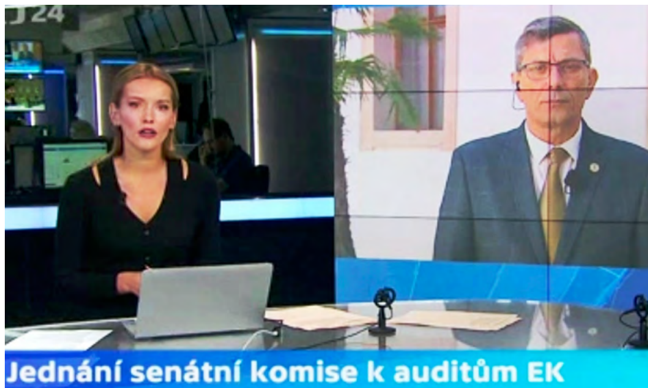
Senátor Zdeněk Nytra v České televizi, která se pravidelně věnuje evropskému auditu premiéra.

Agrofert je jedničkou zemědělsko-potravinářského sektoru v ČR. V roce 2017 získal na zemědělských a dalších dotacích 1,95 miliardy korun, o rok dříve 1,5 miliardy Kč. Roky 2018 a 2019 ještě nejsou finančně uzavřeny.